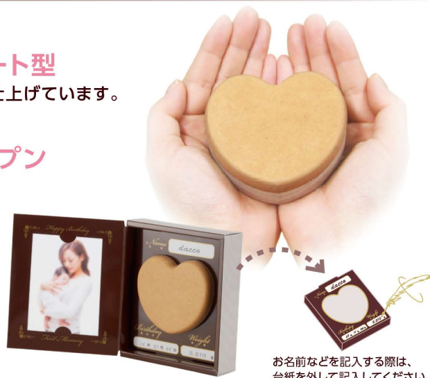
お名前などを記入する際は、台紙を外して記入してください。